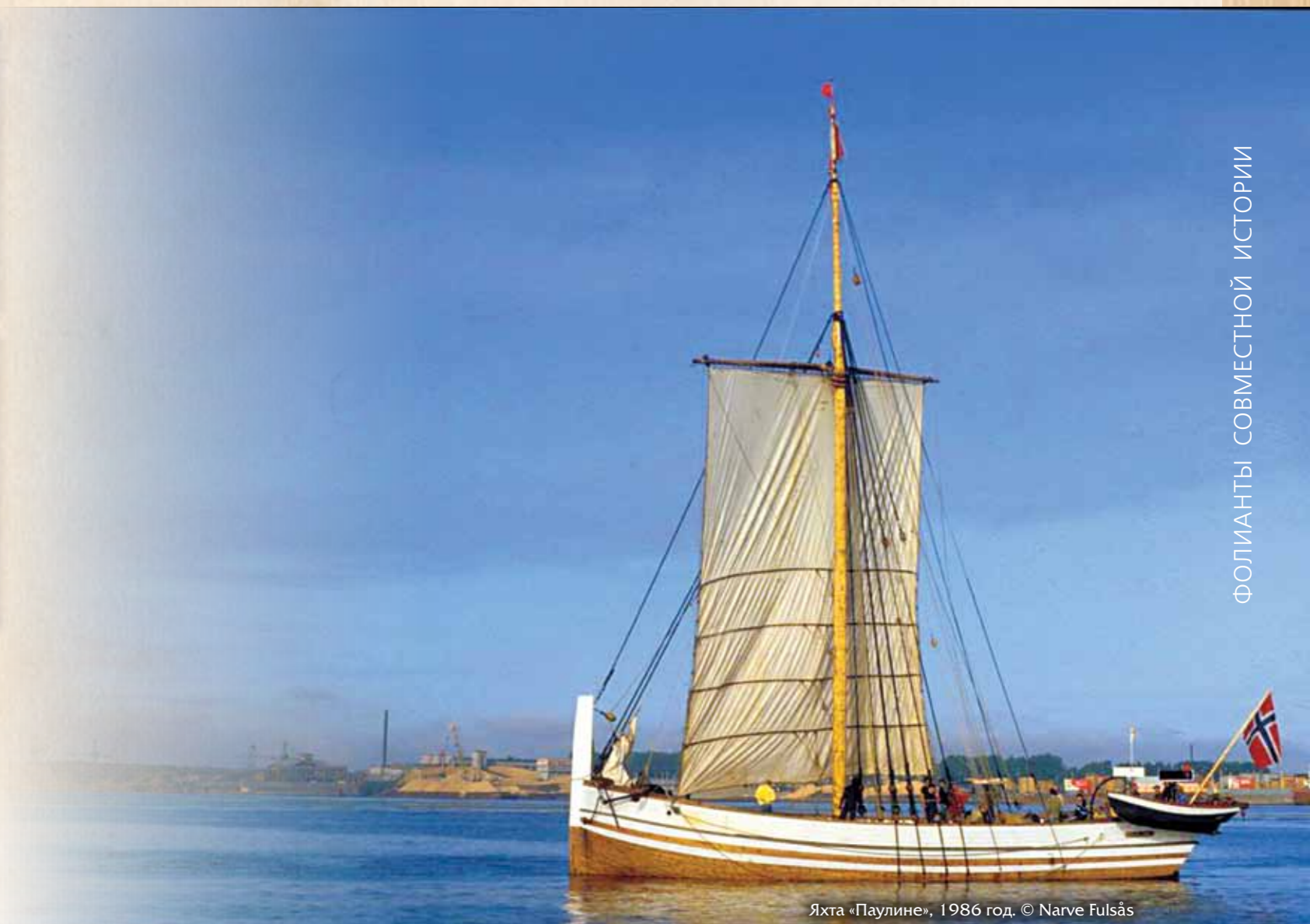
Яхта «Паулине», 1986 год.

Соглашение о сотрудничестве Поморского университета и Университета Тромсё способствовало проведению в ноябре 1992 года научной конференции «Норвежско-русские отношения: 1814–1917. История и культура». В это же время в Тромсё вышел в свет специальный номер журнала музея Тромсё «Отар» с подзаголовком «Норвегия и Россия на Севере» со статьями архангельских