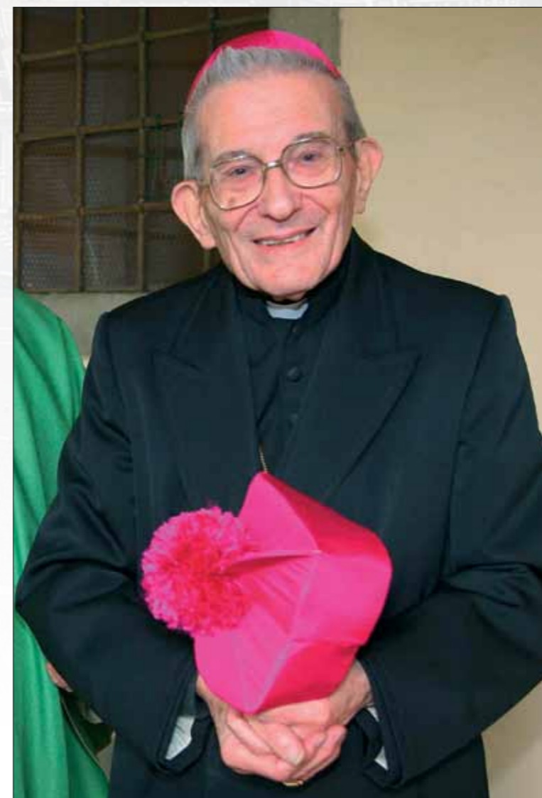
Лорис Франческо Каповилла

Тогдашний руководитель советского государства был далёк от знания, а тем более, понимания церковных проблем. Но он усомнился в достоверности утверждений, исходивших из его ближайшего окружения: уж очень они противоречили информации из открытых и отнюдь не засекреченных источников. Главное же – Хрущёв отдавал себе отчёт в том, насколько серьёзна опасность конфронтации с Западом в условиях